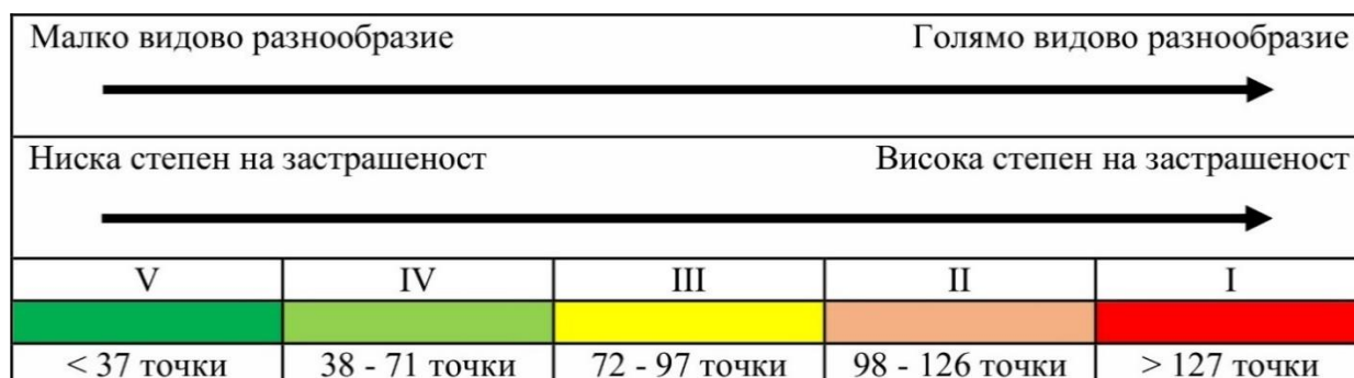
Фиг. 1. Обобщена теглова схема в 5 класа и цветовото им представяне.

Дефинираните „горещи точки“ на фиторазнообразието във флористичния район „Северно черноморско крайбрежие“ (Фиг. 2) са повече на брой и с по-голяма площ в сравнение с „горещите точки“ в подрайона „Южно черноморско крайбрежие“ [1]. Преобладават територии от клас V.